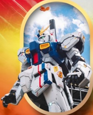
ห้างลาลาพอกันดั้ม