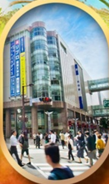
ช้อปปิ้งย่านเท็นจิน