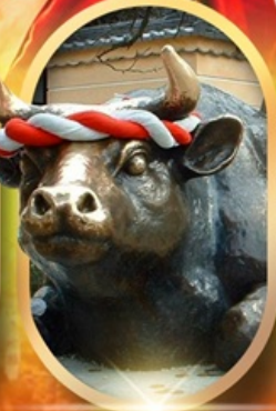
ศาลเจ้าดาไซฟู