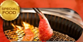
อาหารมือพิเศษ ปิ้งย่างยากินิกุ