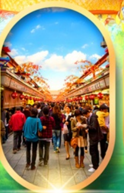
ถนนนากามิเสะ