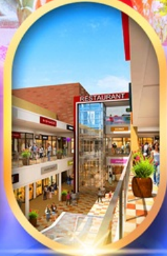
มิตซุยอิจิมุ