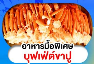
อาหารมือพิเศษ บุฟเฟ่ต์งาปู