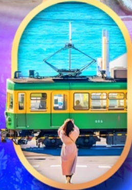
ถนนโคมาจิโคริ