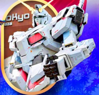
ห้างไอโดะกันดั้ม