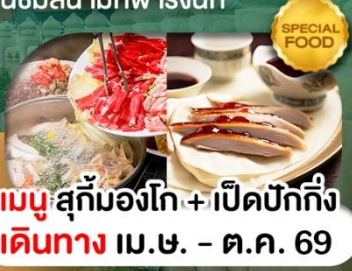
เมนูสุกั่มองโก + เปิดปักกิ่ง เดินทาง เม.ษ. - ต.ค. 69