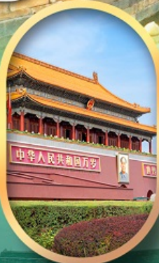
จัสมตรีสเทียนอันเหมิน