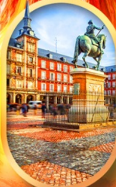
พลาซามายอร์