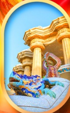
ปาร์ก กูเอล