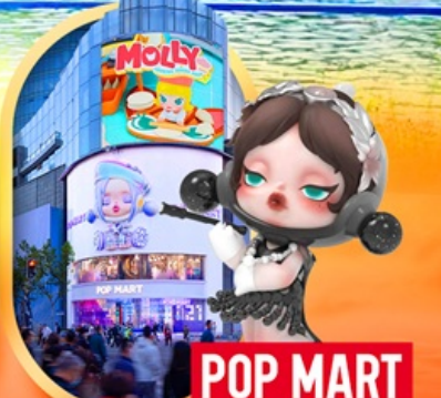
ถนนหนานจิง