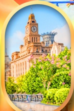
หาดไว่ทานเดอะบิ้นด์