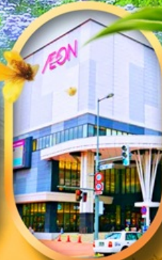
อ็อนมอลล์