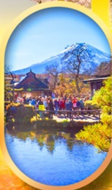
หมู่บ้านน้ำใส