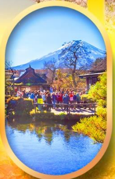
หมู่บ้านน้ำใส