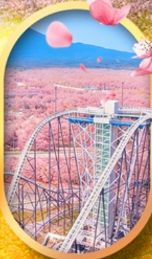
ฟูจิยาม่า ทาวเวอร์