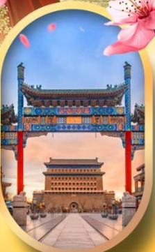
ถนนคนเดินเทียนเหมิน