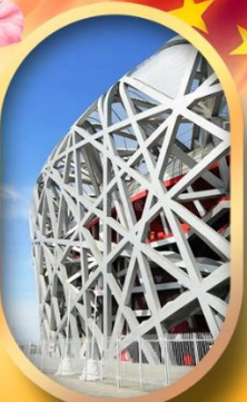
ผ่านชมสนามกีฬาฟาริงก