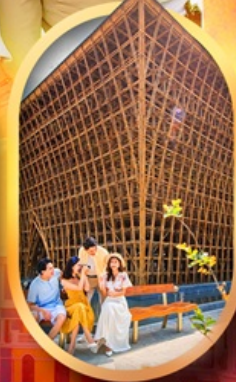
อาคารไม้ไผ่