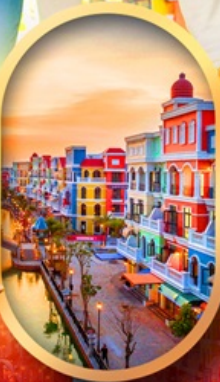
เวนิสแห่งเวียดนาม