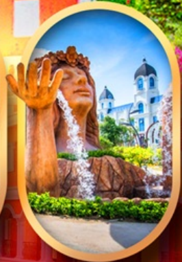
น้ำตกเทพพิหญิง