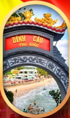
ศาลเจ้าติงเกา