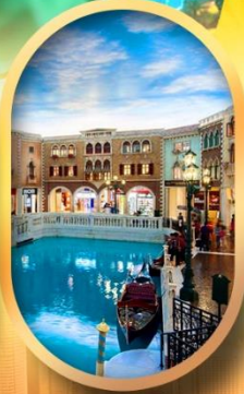
เดอะเวนิเซียน