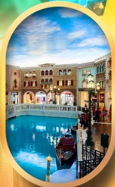
เดอะเวนิเซียน