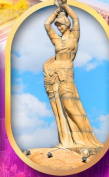
เด็กหญิงชาวประมง