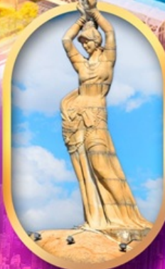
เด็กหญิงชาวประมง