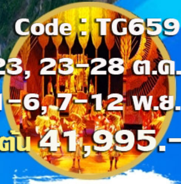
โซ่วทิเบต