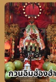
กวนอิมฮ่องฮ่า