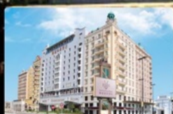
Grand Inn Hotel

กินอิ่ม นอนอุ่น พักหรู อยู่ดี การ์ันตี 4 ดาว