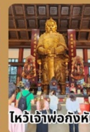
ไหว้เจ้าพ่อกั้งหัน