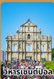
อิหารเซนต์ปอล