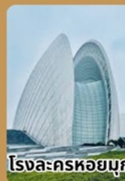
โรงละครหยกมุก