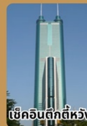
ซีคอินตีกีห้วง