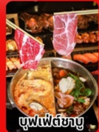
บุฟเฟ่ต์ซาบู