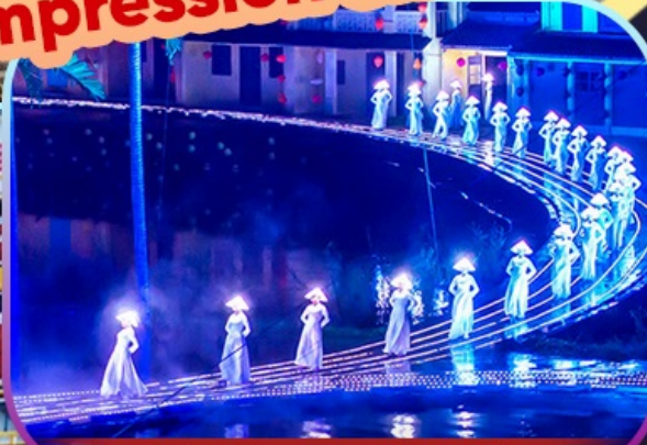
Hoi An Impression Show