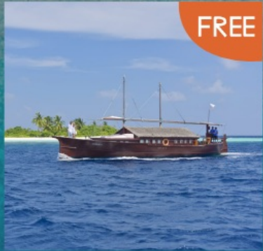
Safari Boat Trip