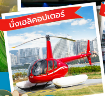
นั่งเฮลิคอปเตอร์