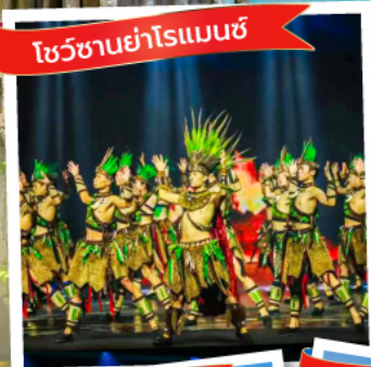
โชว์ขานยาโรแมนซ์