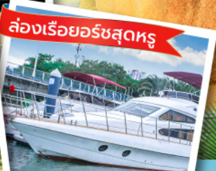
ล่องเรือยอร์ชสุดหรู