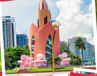
Nha Trang Cathedral