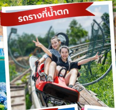
รถรางที่น้ำตก