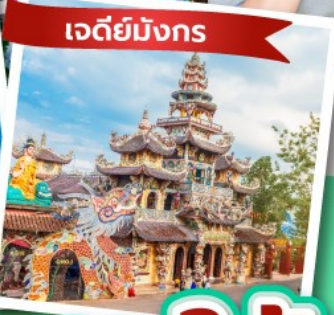
เจดีย์มิงกร