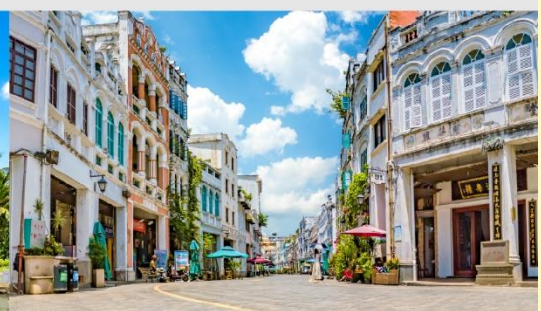
ถนนโบราณฉีไหลว