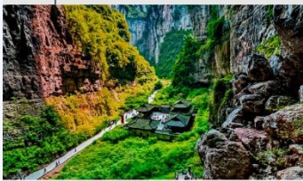
อุทยานแห่งชาติหลุมฟ้า 3 สะพานสวรรค์