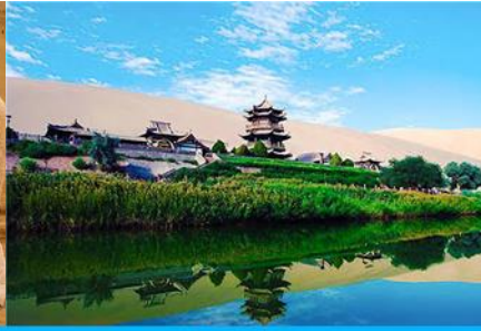
สระน้ำวงพระจันทร์