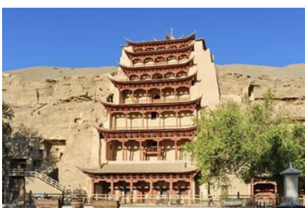
ถ้ำหินมั่วเกา

พักที่ METRO PARK HOTEL โรงแรมระดับ 4 ดาวหรือเทียบเท่าในเมืองตุนหวง