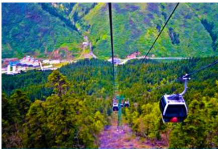
นั่งกระเช้าขึ้นสู่อุทยานหวงหลง

พักที่ JIUYUAN HOTEL ระดับ 4 ดาวท้องถิ่นหรือเทียบเท่าในอุทยานจิวจ้ายโกว