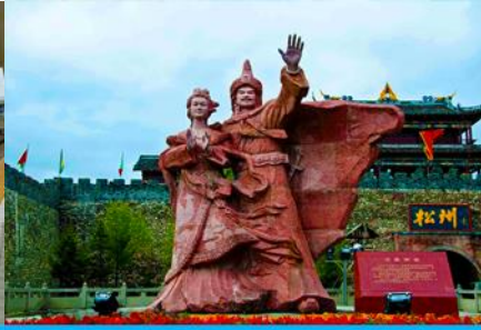
เมืองโบราณซงพาน