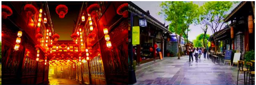
ถนนโบราณสถานจิ้นหลี่