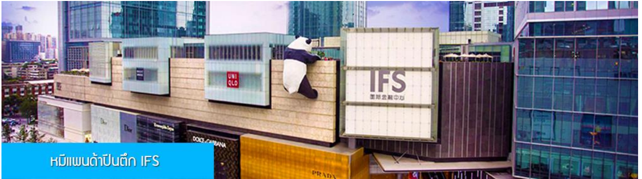
หมีแพนด้าปีนตึก IFS