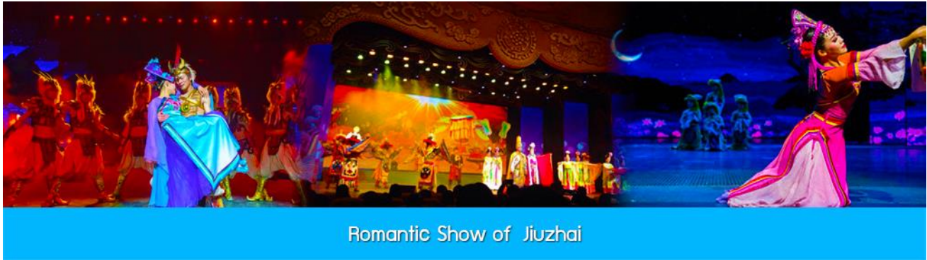
Romantic Show of Jiuzhai

หลังอาหารนำท่านสามารถเลือกซื้อรายการทัวร์เสริม พิเศษการแสดง ชุด Romantic Show of Jiuzhai เป็นการแสดงที่จัดขึ้นในโรงละครขนาดใหญ่ โดยการทุ่มทุนสร้างมหาศาล ทั้งเวที ฉากการแสดง ระบบ แสง สี เสียงที่ไฮเทค และทีมนักแสดงคัดสรรจากโรงเรียนนาฏศิลป์ เป็นการร้อยเรียงเรื่องราวของชนพื้นเมือง ประเพณีท้องถิ่น และเรื่องราว ตำนานในอดีต มาถ่ายทอดเป็นรูปแบบการแสดงที่อลังการละประทับใจ.....อัตราบัตรเข้าชม 400 หยวน หรือ 2,000 บาท/ท่าน หรือสอบถามรายละเอียดเพิ่มเติมได้ จากไกด์ท้องถิ่นหรือหัวหน้าทัวร์