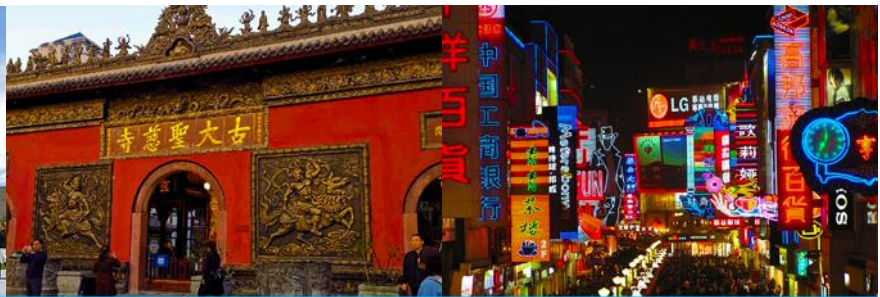
วัดต้าฉือ