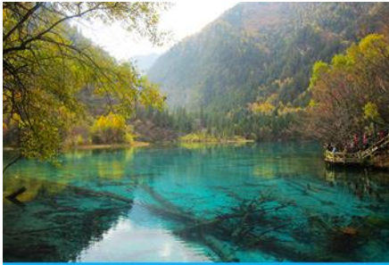
อุทยานจิวจ้ายโกว