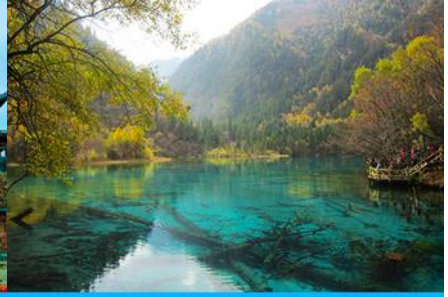
อุทยานจิวจ้ายโกว