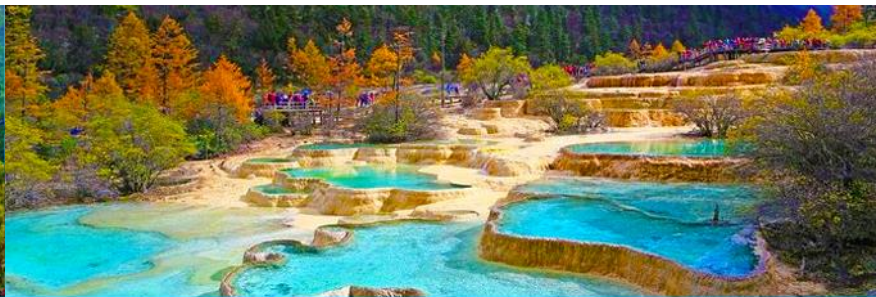
อุทยานหวงหลง

วันที่ 1 อุทยานจิวจ้ายโกว – อุทยานหวงหลง (รวมกระเช้าและรถกอล์ฟขาขึ้น) – เมืองเม่าเซียน