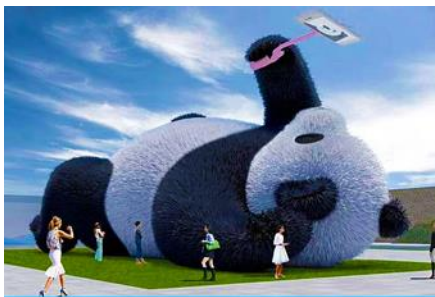
ตุ๊กตาแพนด้าอนเซลฟี

พักที่ MAOXIAN INTER HOTEL โรงแรมระดับ 4 ดาวหรือเทียบเท่าในเมืองเม่าเซียน