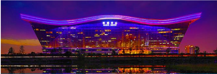
Chengdu new century global center