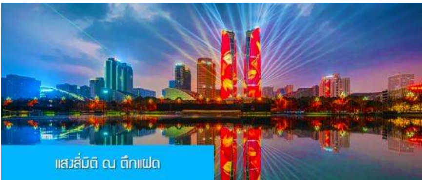
แสงสีมิตติ ณ ตึกแฝด