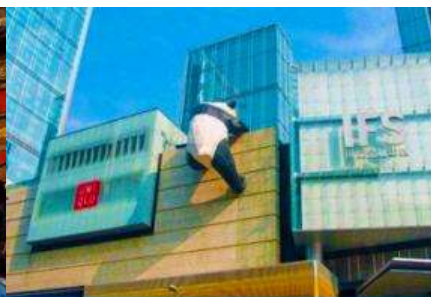
หมีแพนด้าปีนตึก ณ ตึก IFS