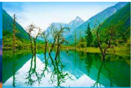
หุบเขาชวงเจียวโกว