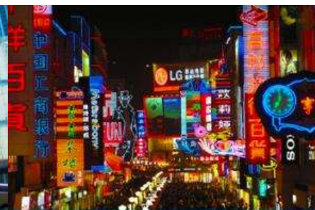
ถนนคนเดินชุนซีลู่