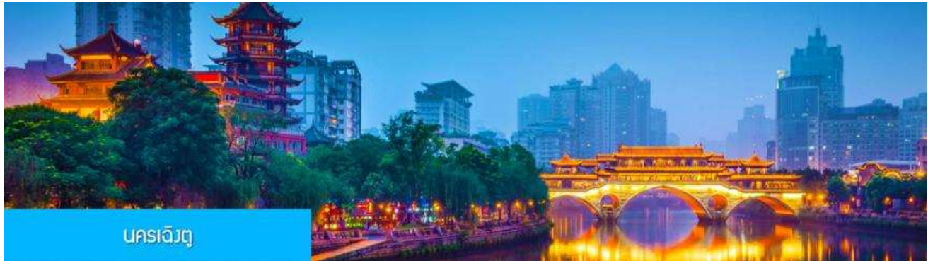
นครเฉิงตู