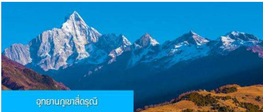
อุทยานภูเขาสี่ครุณี

หลังอาหารนำท่านเที่ยวชม หุบเขาชวงเจียวโกว 双桥沟景区 ที่เป็นแหล่งท่องเที่ยวที่สวยงามที่สุดแห่งหนึ่งในเขตอุทยานภูเขาสี่ครุณี นำท่านนั่งรถบัสนของอุทยานที่วิ่งไปผ่านเส้นทางที่สร้างคู่ขนานกับลำธารกษยในหุบเขา ท่านจะได้สัมผัสกับความสวยงามของทัศนียภาพธรรมชาติที่หาชมได้ยาก โดยมีภูเขาหิมะสูงตระหง่านอยู่เบื้องหลัง ธารน้ำใสไหลริน และสระน้ำที่มีสีเขียวมรกต ในฤดูใบไม้ผลิและฤดูร้อนท่านจะได้เห็นฝูงจามรีท่ามกลางทุ่งหญ้าเขียวจี ส่วนในฤดูหนาวทุ่งหญ้าและพื้นดินจะปกคลุมด้วยพรมหิมะสีขาว...รถบัสนของอุทยานจะนำนักท่องเที่ยวไปยังจุดชมวิวสำคัญต่าง ๆ ภายในเขตอุทยาน เพื่อให้ท่านท่องเที่ยวได้เที่ยวชมสถานที่และถ่ายรูปตามอัชฌาศัย จนครบแ่เวลา นำคณะขึ้นรถบัสนออกจากอุทยาน