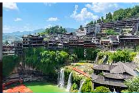
เมืองโบราณฟูหวงเจิน