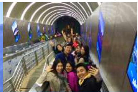
บันไดเลื่อนทะเลภูเขา