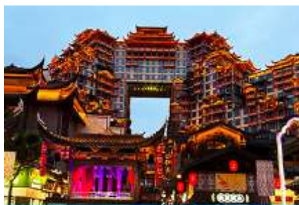
ตึกมหาศรัย 72 ชั้น

พักที่ ZHENMIAN HOTEL โรงแรมระดับ 4 ดาวหรือเทียบเท่าในเมืองจางเจี๋ยเจี๋ย