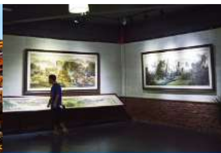
พิพิธภัณฑ์ภาพหินทราย