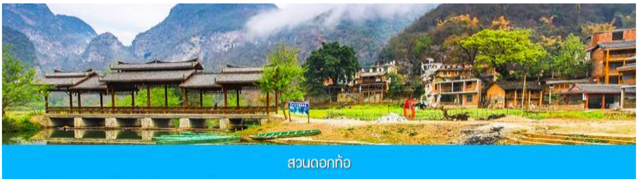
สวนดอกท้อ