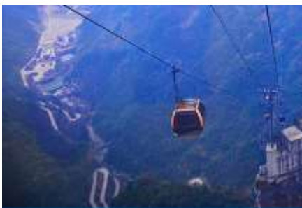
กระเช้าขึ้นเทียนเหมินซาน

https://hk.trip.com/hotels/guzhang-hotel-detail-68614854/chaxitai-holiday-hotel/