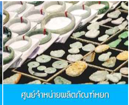
ศูนย์จำหน่ายผลิตภัณฑ์หยก

วันที่ห้า เมืองจางเจียเจีย – เลือกซื้อโปรแกรมทัวร์เสริม ออฟชั่น สะพานกระจกข้ามหุบเขาแกรนด์แคนยอน) – ร้านหยก- ร้านใบชา – เดินทางกลับเมืองหยี่ชัง