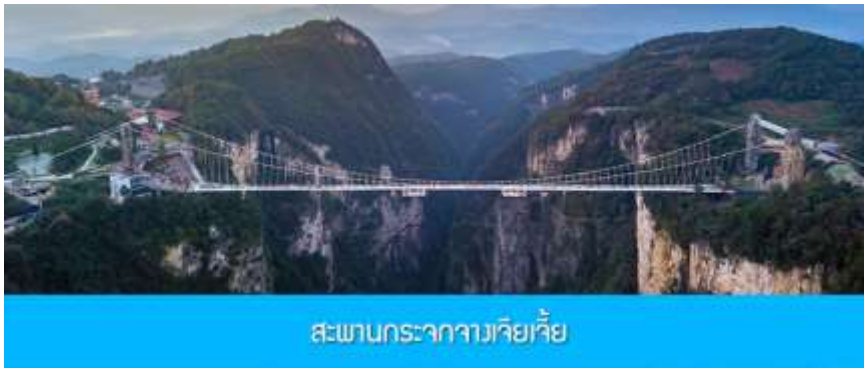
สะพานกระจกจางเจียเจีย

อัตราค่าบริการสำหรับโปรแกรมเสริมการแสดงชุด The love Story of Wooden man and Fairy Fox ท่านละ 400 หยวน (หรือ 2,000 บาทขึ้นอยู่กับอัตราแลกเปลี่ยน) ระยะเวลาที่ใช้ในการเที่ยวชมการแสดง ประมาณ 3 ชั่วโมง รวมเวลาเดินทางไป กลับค่าบริการรวม ค่าบัตรเข้าชม ค่ารถรับ ส่ง และค่าน้ำดื่มของไกด์ท้องถิ่นพักที่ GUIYUANZHENPIN HOTEL โรงแรมระดับ 4 ดาวหรือเทียบเท่าในอุทยานหวู่หลิงหยวน