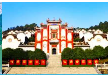
บ้านเกิดกวี ชวีหยวน

วันที่สอง ล่องเรือชมเขื่อนสามผา – บ้านเกิดกวี ชวีหยวน – สวนดอกท้อ – Wedding Banquet – เมืองจางเจี๋ยเจี๋ย