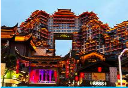
ตึกมหัศจรรย์ 72 ชั้น

พักที่ ZHENMIAN HOTEL โรงแรมระดับ 4 ดาวหรือเทียบเท่าในเมืองจางเจียเจีย