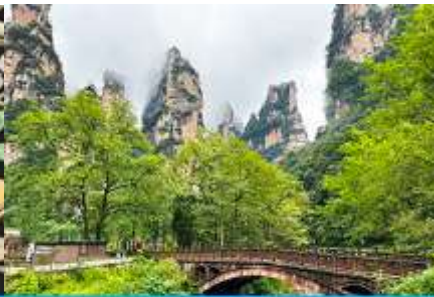
จุดชมวิวจินเปียนซี