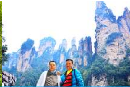
ชมจุดชมวิวลีฟท์แก้ว