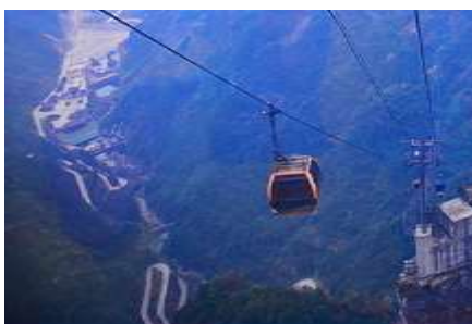
กระเช้าขึ้นเทียนเหมินซาน

https://hk.trip.com/hotels/guzhang-hotel-detail-68614854/chaxitai-holiday-hotel/