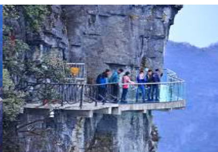
หน้าพลาวยฟ้าทางเดินกระจก