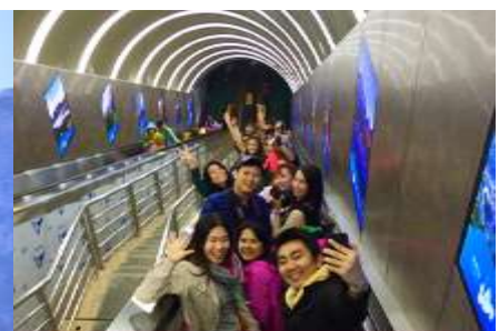
บันไดเลื่อนทะเลภูเขา

วันที่สี่ เมืองโบราณฝูหรงเจิน – ศูนย์ผลิตภัณฑ์ยางพารา– กระเช้าขึ้นเขาเทียนเหมินซาน – ระเบียงแก้ว เลียบหน้าผา – บันไดเลื่อนทะเลภูเขา – (เลือกซื้อโปรแกรม ออฟชั่น โชว์จิ้งจอกขาว)