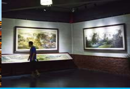
พิพิธภัณฑ์ภาพหินทราย