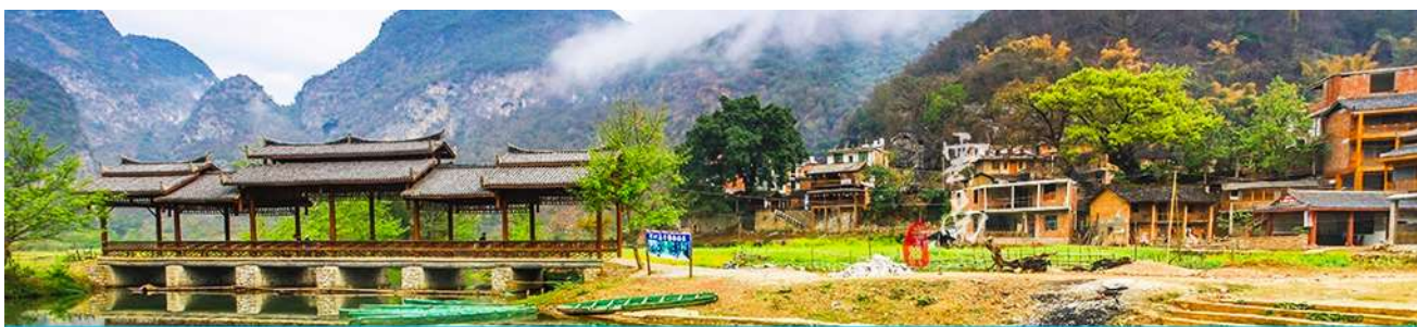
สวนดอกท้อ