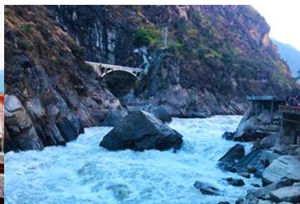
ช่องแคบเสื่อกระโอบ