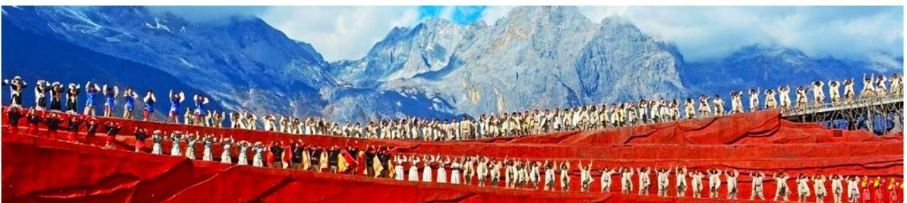
การแสดง IMPRESSION LIJIANG

ชม การแสดง IMPRESSION LIJIANG โชว์อันยิ่งใหญ่โดยผู้กำกับชื่อก้องโลก “จาง อี้โหมว” ได้เนรมิต ให้ภูเขาหิมะมังกรหยกเป็นฉากหลัง และบริเวณทุ่งหญ้าเป็นเวทีการแสดง โดยใช้นักแสดงกว่า 600 ชีวิต แสง สี เสียง การแต่งกายตระการตา เล่าเรื่องราวชีวิตความเป็นอยู่ และชาวเผ่าต่างๆของเมืองลี่เจียง