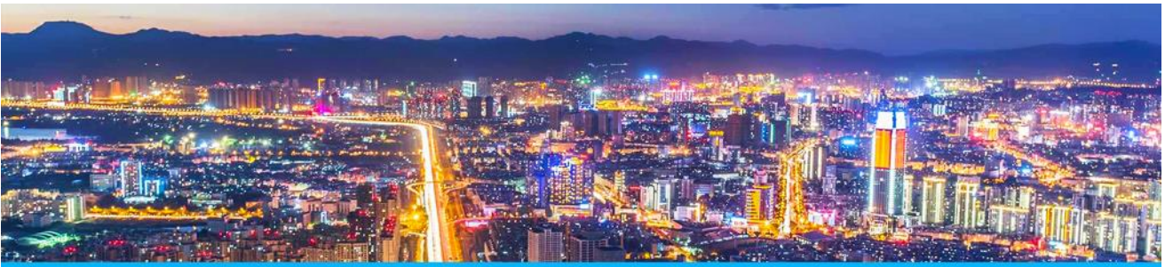
นครคุนหมิง