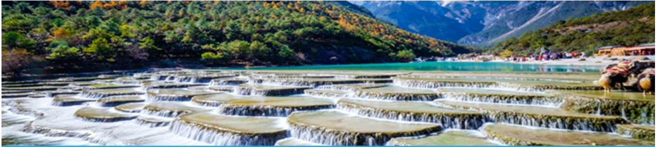
หุบเขาพระจันทร์สีน้ำเงิน Blue Moon Valley

หมายเหตุ กรณีที่กระเช้าใหญ่ขึ้นภูเขาหิมะมังกรหยกปิดให้บริการ ด้วยเหตุที่สภาพอากาศไม่เอื้ออำนวย หรือเป็นการปิดเพื่อตรวจสอบสภาพและซ่อมแซมประจำปี ทางทัวร์ขอสงวนสิทธิ์ที่จะจัดโปรแกรมขึ้นกระเช้า ที่จุดชมวิวกุเขาหิมะมังกรหยก ณ สถานีกระเช้าหุยซานผิง แทน