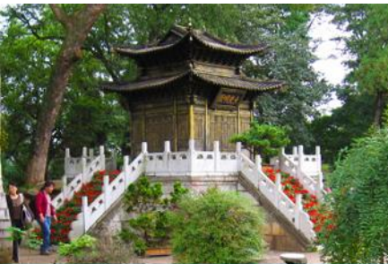
ตำหนักกวงจินเตียน

พักที่ JINHUA HOTEL ระดับ 4 ดาวหรือเทียบเท่าในเมืองคุนหมิง