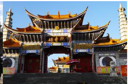
วัดเจ้าแม่กวนอิมเปลวกาย