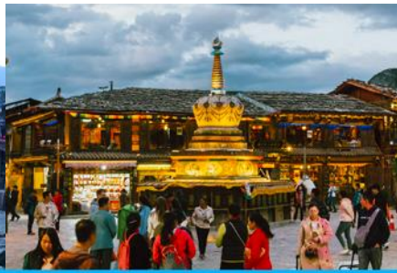
เมืองโบราณแซงกริล่า