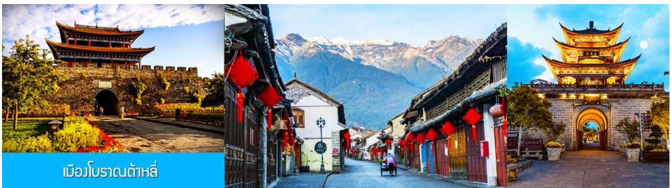
เมืองโบราณต้าหลี่

หลังอาหารนำท่านชม เมืองโบราณแห่งต้าหลี่ สร้างขึ้นเมื่อกว่า 1,000 ปีก่อน สัมผัสบรรยากาศอันสงบเงียบของ เมืองไท่เหอ สองฟากของถนนสายเก่าแก่มีบ้าน โบราณปลูกสร้างไว้อย่างกระจัดกระจาย มีถนนสายเก่าแก่ที่ตัดผ่านตัวเมืองโบราณสายหนึ่งซึ่งทุกวันนี้ได้กลายเป็นถนนย่านการค้าที่เจริญคึกคักตามสองข้างถนนเต็มไปด้วยร้านค้าต่างๆ มีพ่อค้าชาวชนชาติไปที่แต่งชุดประจำชนชาติกำลังค้าขายสินค้าพื้นเมืองต่างๆ เช่น หินอ่อนต้าหลี่ ผ้าพื้นเมืองและเครื่องเงิน เป็นต้น