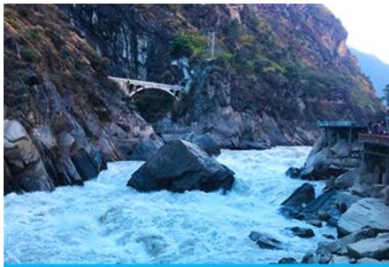
ช่องแคบเสือกระโจน