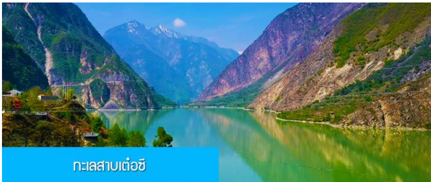
ทะเลสาบเต้อชี

พักที่ SI GUNIANG SHAN HOTEL 4* หรือระดับ4ดาวพื้นเมือง