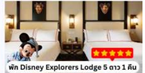
พิน Disney Explorers Lodge 5 ดาว 1 คืน