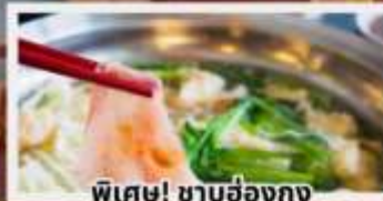
พิเศษ! ชาบูฮ่องกง