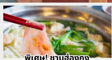
พิเศษ! ซาบูฮ่องกง