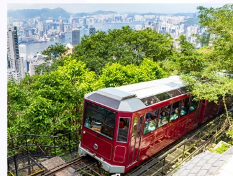
รถรางพิกแคม