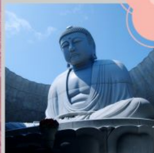
"HILL OF BUDDHA"