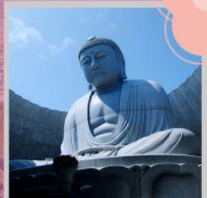
"HILL OF BUDDHA"