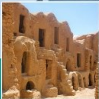
KSAR EL FARCH