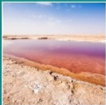
CHOTT EL DJERID