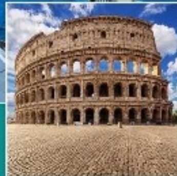
EL JAM COLISEUM