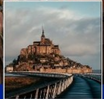
MONT SAINT MICHEL