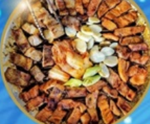
อาหารพรีเมียม ไม่จรงานทัวร์