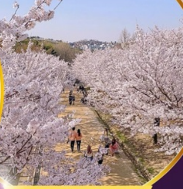
ชมซากุระ Seoul Forest