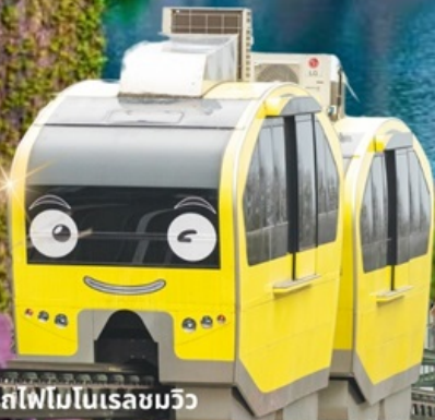
นั่งรถไฟโมโนเรลเซมวิว