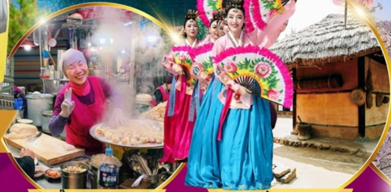
ป่าเกี้ยว ตลาดกวางจง