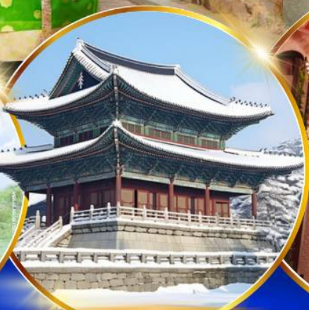
พระราชวังเคียงบกกรุง