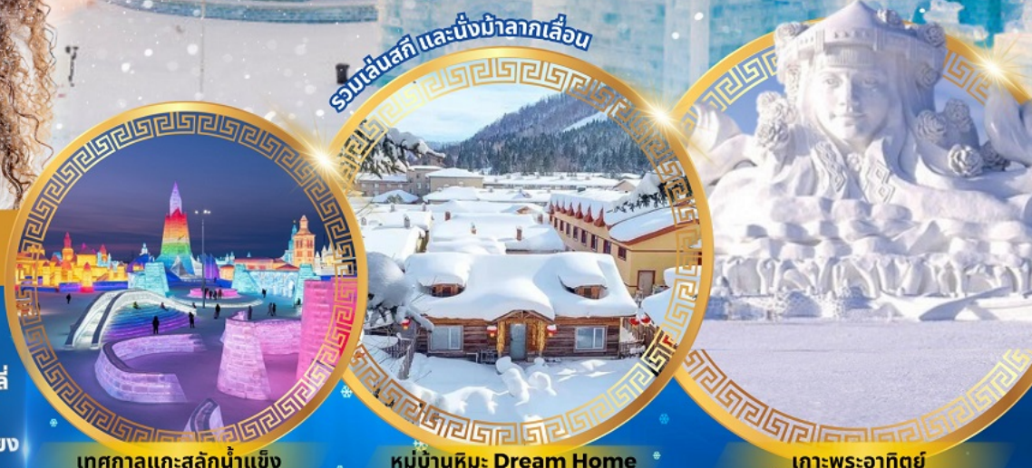
เทศกาลแกะสลักน้ำแข็ง

จตุรัสโบสถ์เซินโซเฟีย ถนนจงหยาง หมู่บ้านหิมะดินแดนมหัศจรรย์ อนุสาวรีย์ฝั่งหง สนุกสนานกับลานสกียาปูลี่ ถนนแอสซูนเจีย เขาแกะหลัว เขาปังจวู ภาพเขียน Ice and Snow แม่น้ำซงฮัวเจียง โซ่วว้ายน้ำแข็ง เกาะพระอาทิตย์