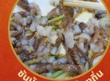
ซันนิกอิ อาหารท้องถิ่น