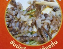
ชั้นนักชี อาหารท้องถิ่น