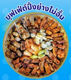
บุฟเฟ่ต์ปังอย่างไม่อื่น