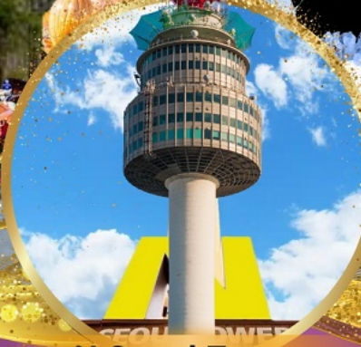
N Seoul Tower