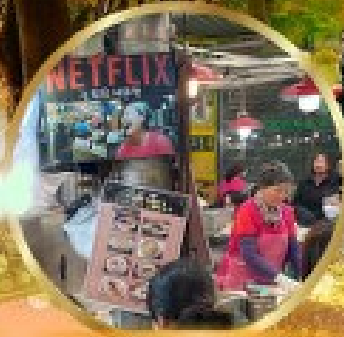
สตรีทฟู้ดตลาดกวางจง

สนุกสุดเหวี่ยงกับกิจกรรมขบวน LUGE !! พิเศษ !! นั่งกระเช้าชมวิว 360° เมืองคังฮวา