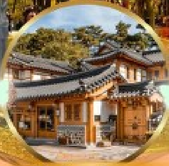
หมู่บ้านโบราณอินพยอง