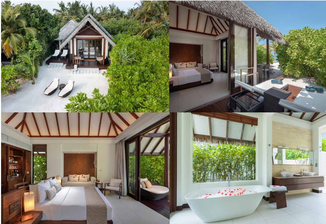
รูปห้อง Beach Villa

**เด็กสามารถเข้าพักได้เฉพาะห้อง Ocean Villa**