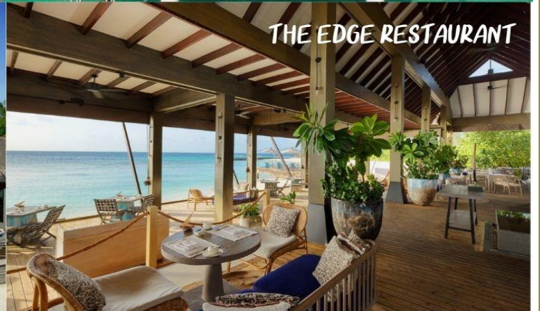
THE EDGE RESTAURANT