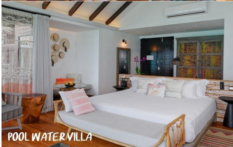
POOL WATER VILLA