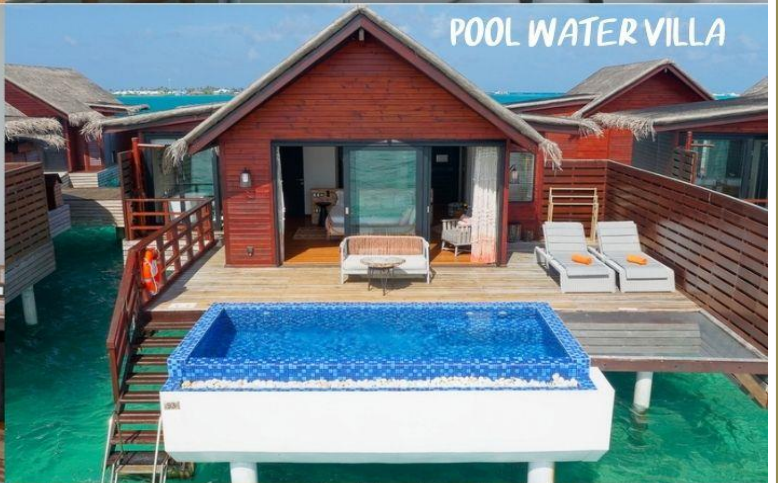
POOL WATER VILLA