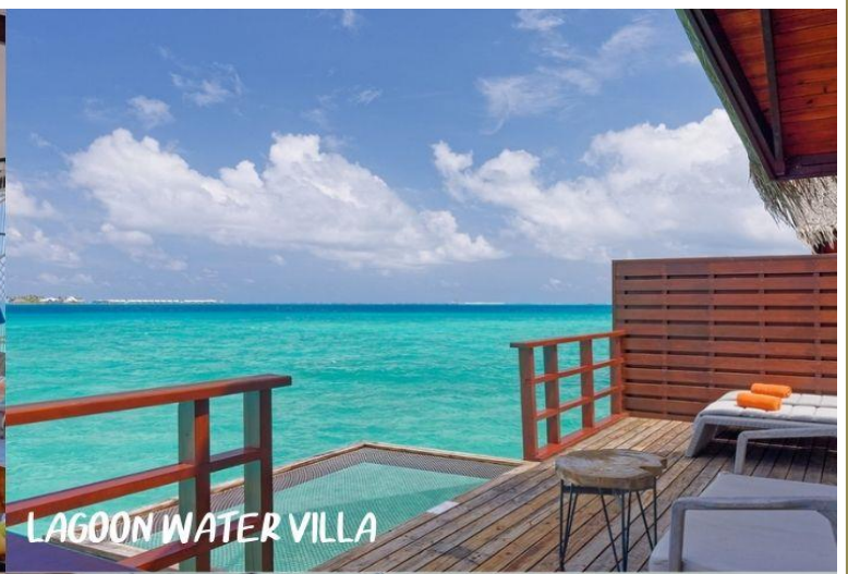
LAGOON WATER VILLA