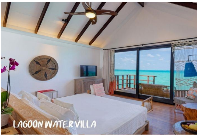
LAGOON WATER VILLA