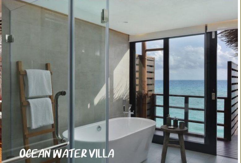
OCEAN WATER VILLA