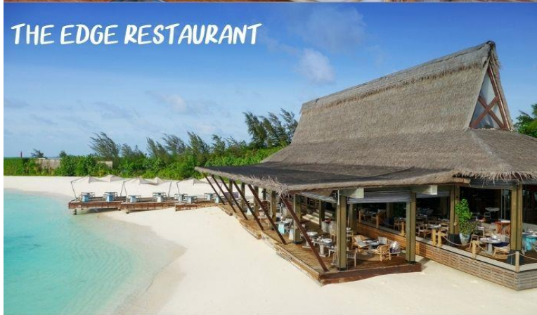
THE EDGE RESTAURANT