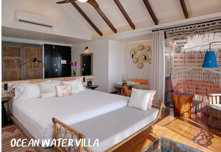
OCEAN WATER VILLA