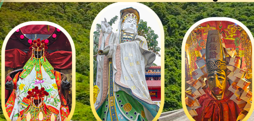
เจ้าแม่กวนอิมฮ่องฮำ วัดเจ้าแม่กวนอิมรี พลัสเมย์ วัดหลินฟ้า