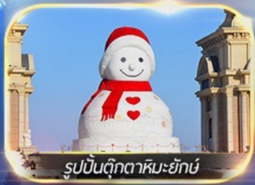
รูปปั้นตุ๊กตาหิมะยักษ์