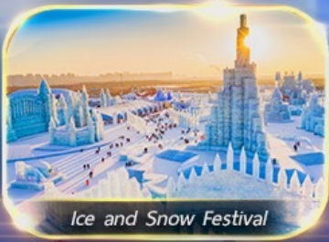
Ice and Snow Festival