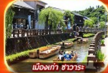
เมืองเก่า ซาวาระ