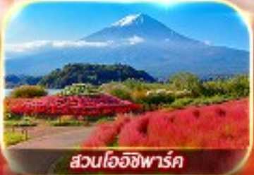
สวนโอบิฮิฟารุค