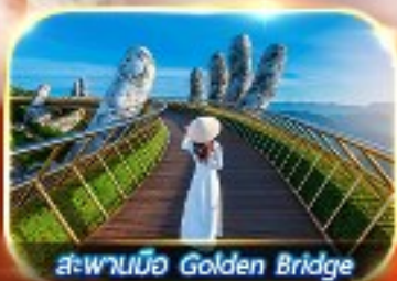
สะพานมือ Golden Bridge