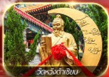
ไหว้หวังต้าเซียน