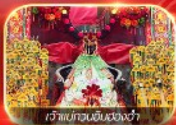
เจ้าแม่ทวนอินฮ่องงำ