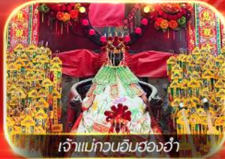
เจ้าแม่กวนอิมสองอ่า