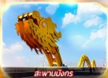
สะพานมังกร