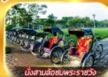
นั่งสามล้อชมพระราชวัง

สัมผัสความสวยงามหมู่บ้านสไตลฝรั่งเศสที่บานาวิลล่า วัดเทียนมู่ พระราชวังเว้ สัมผัสเมืองโบราณฮอยอัน ล่องเรือกระดิง