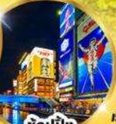
ช้อปปิ้ง ชินไซบาชิ

ราคา เริ่มต้น 26,919 บาท รวมภาษีมูลค่าเพิ่ม 7%